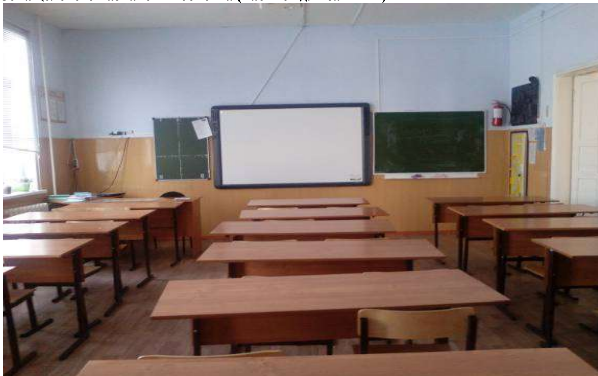
Фото № 12

Зона целевого назначения объекта (кабинет для занятий)