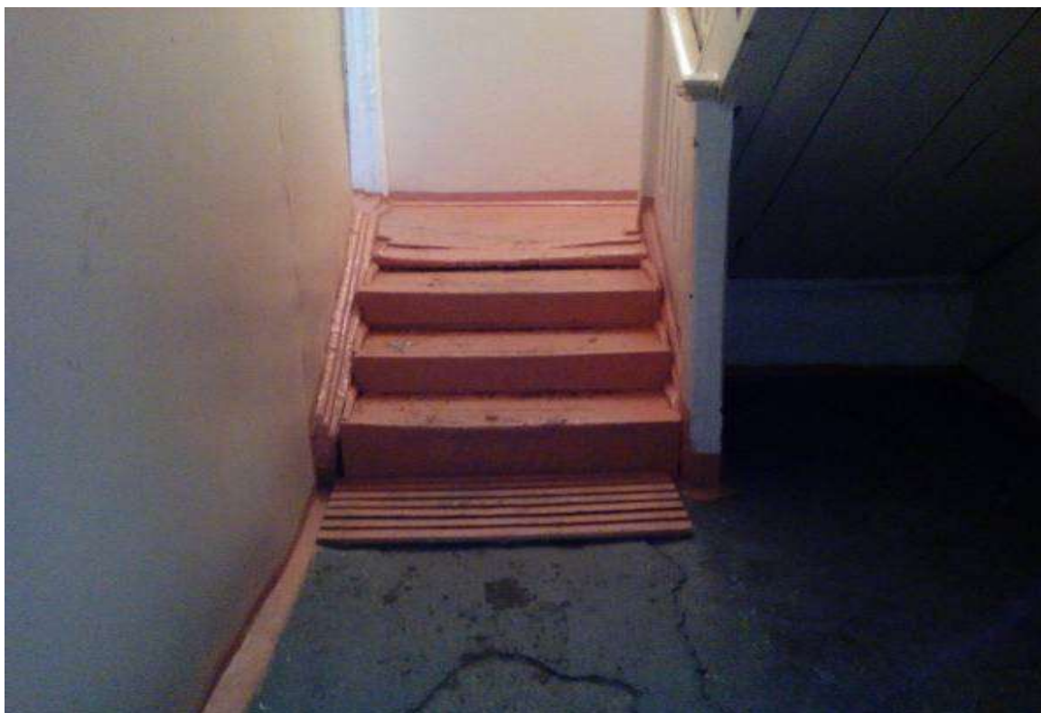
Фото № 4 Пути передвижения