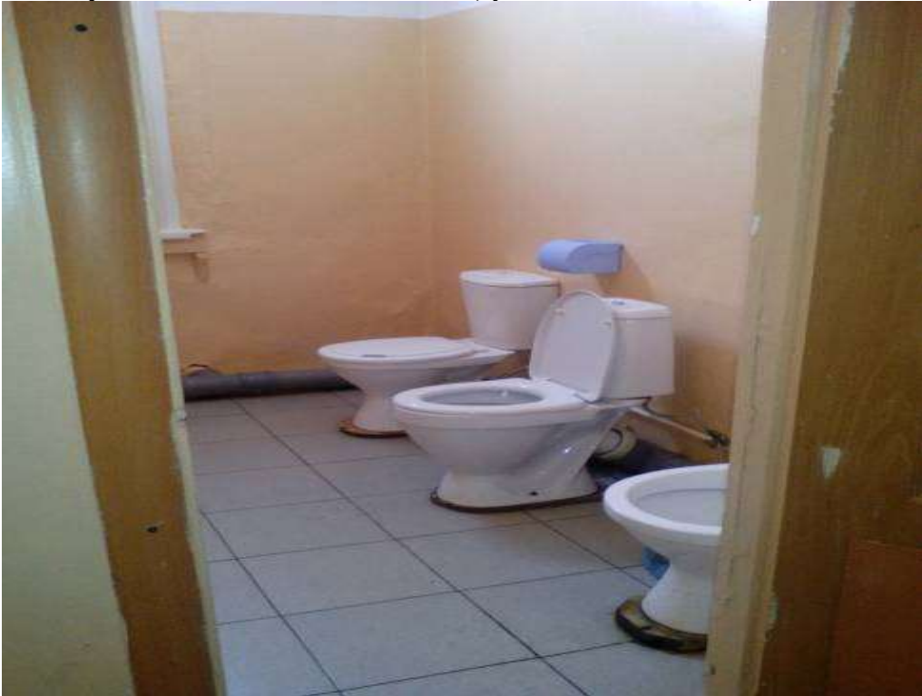
Фото № 14