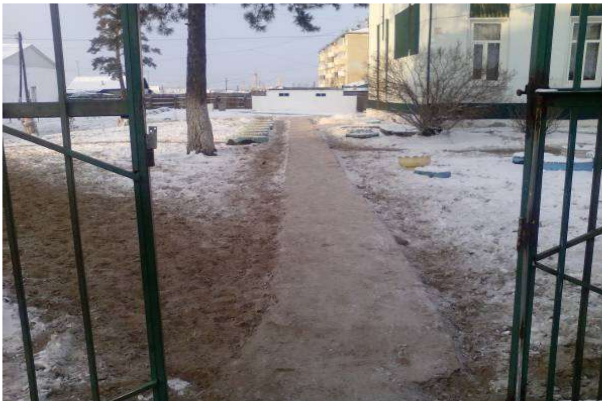
Фото № 2 Вход в здание