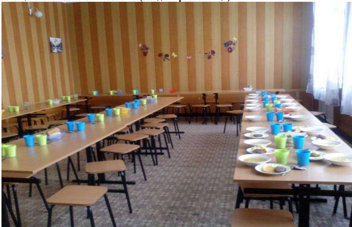
Фото № 10

Зона целевого назначения объекта (зал для приема пищи)