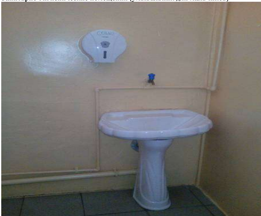
Санитарно-гигиенические помещения (умывальник для мальчиков)