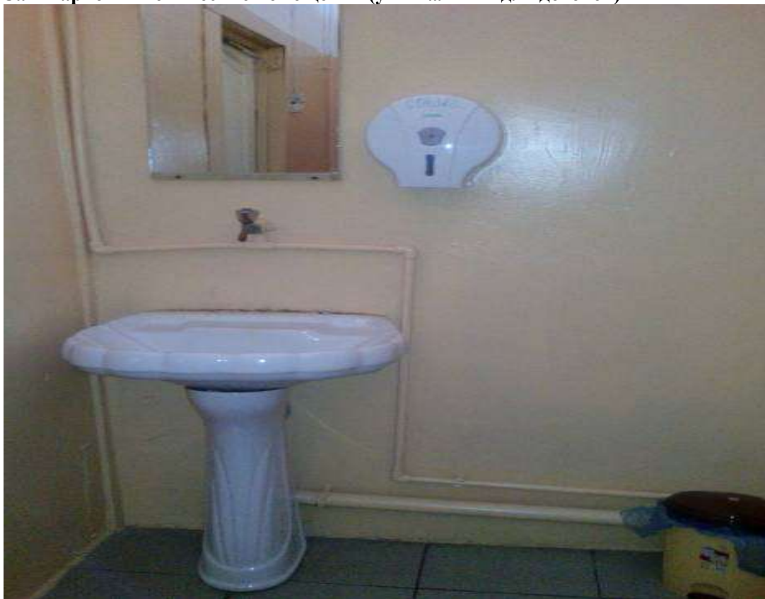
Фото № 16