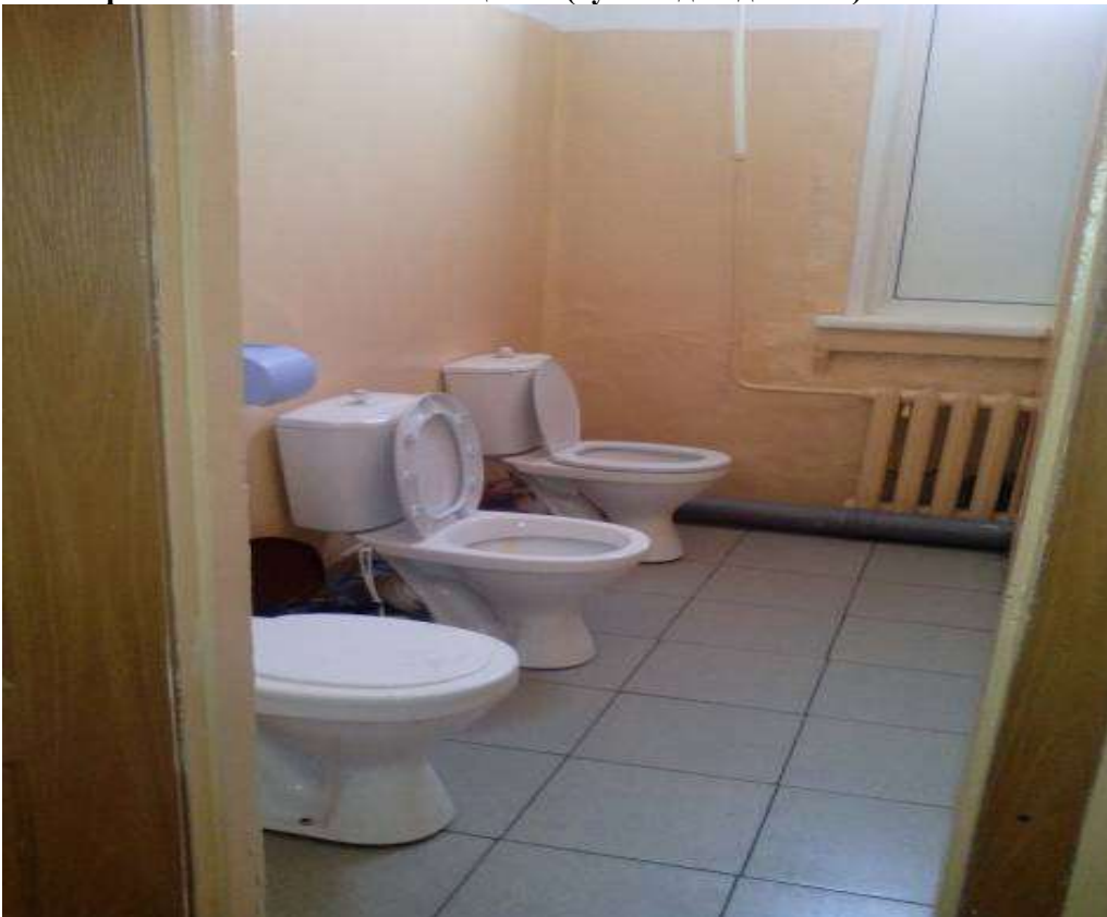
Санитарно-гигиенические помещения (туалет для девочек)