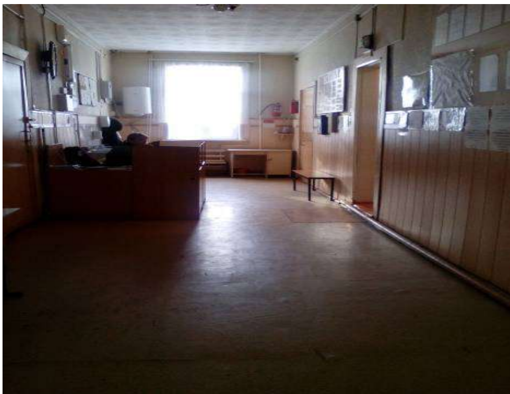
Фото № 6 Коридор 2 этажа