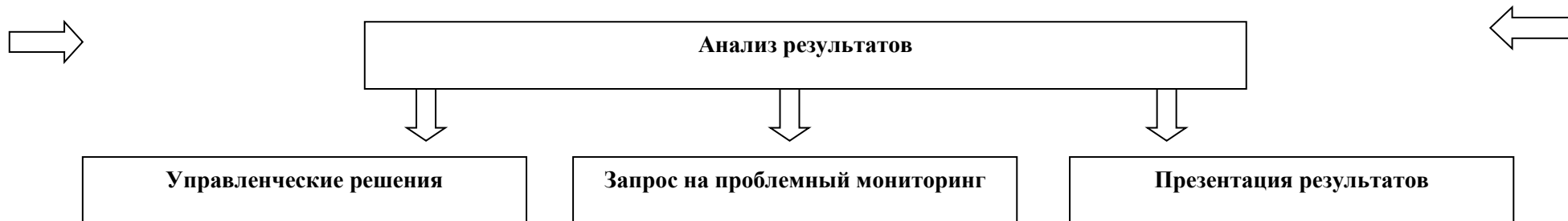
Схема оценки качества общего образования